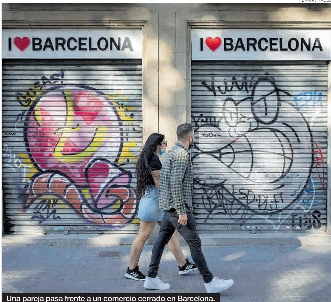
Una pareja pasa frente a un comercio cerrado en Barcelona.

El periodo analizado, entre abril y junio, abarca el grueso del estado de alarma, que duró de mediados de marzo hasta la segunda quincena de junio. El INE explicó que la declaración de estado de alarma recogida en el real decreto 463/2020 ha limitado la actividad de los juzgados en el segundo trimestre de este año, con una tasa de respuesta que se ha situado en el 55%. Además, el decreto 16/2020 promulgado por el Gobierno durante el confinamiento permite a los empresarios aguantar el concurso hasta el 31 de diciembre. Pero, según los expertos, la realidad es que no evitará que en septiembre y octubre vuelvan a incre-