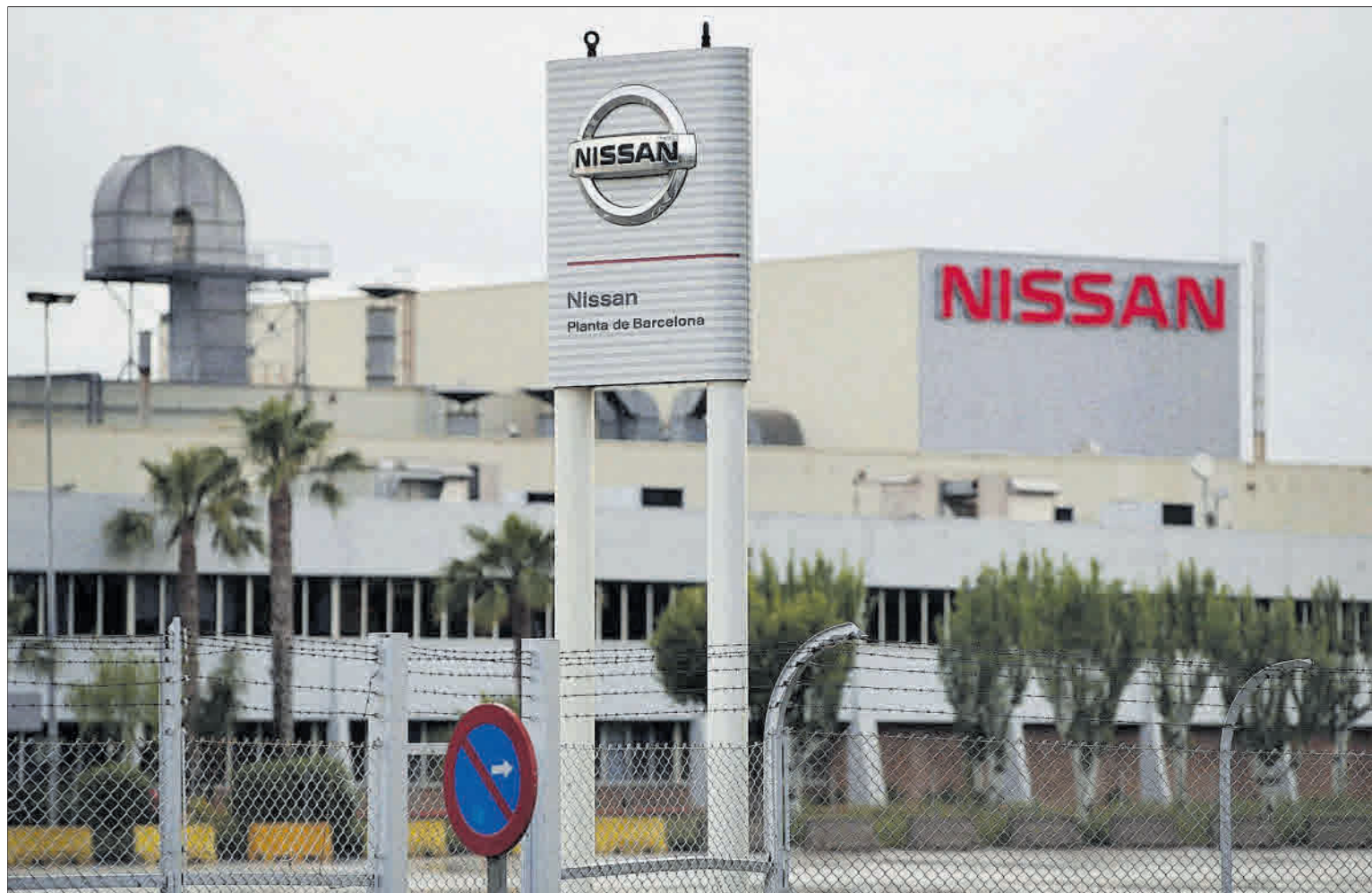
►► Planta de Nissan en la Zona Franca, que se puso en marcha hace 40 años.

Según los datos de la Airef, aun siendo considerables, los menores intertrimestrales se registraron en Extremadura (-12,5%); Murcia (-13,5%) y Cantabria (-14,4%). La Comunidad de Madrid, que el año pasado consolidó la primera posición en el PIB frente a Catalunya, se situó también un poco por debajo de la media, con el 18%. El segundo trimestre es el que incluye la mayor parte del estado de alarma. El Banco de España ya calculó que el conjunto de la economía llegó a derrumbarse un 50% durante el momento más álgido del confinamiento, entre el 30 de marzo y el 9 de abril.